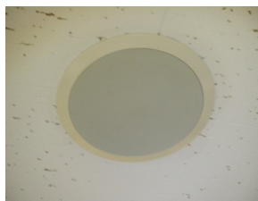
非常放送(室内スピーカー)