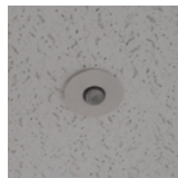
スプリンクラーヘッド